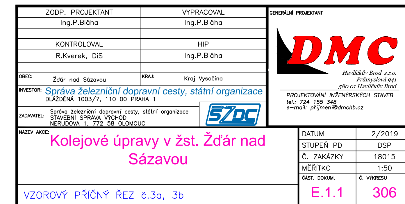
VZOROVÝ PŘÍČNÝ ŘEZ č.3b km 87,515 537

SO 01-16-01 Žst. Žďár nad Sázavou, železniční spodek SO 01-17-01 Žst. Žďár nad Sázavou, železniční svršek Veškerá práva vyhrazena. Tento výkres a detail je majetkem projektanta a nesmí být použit celý ani z části bez písemného souhlasu.